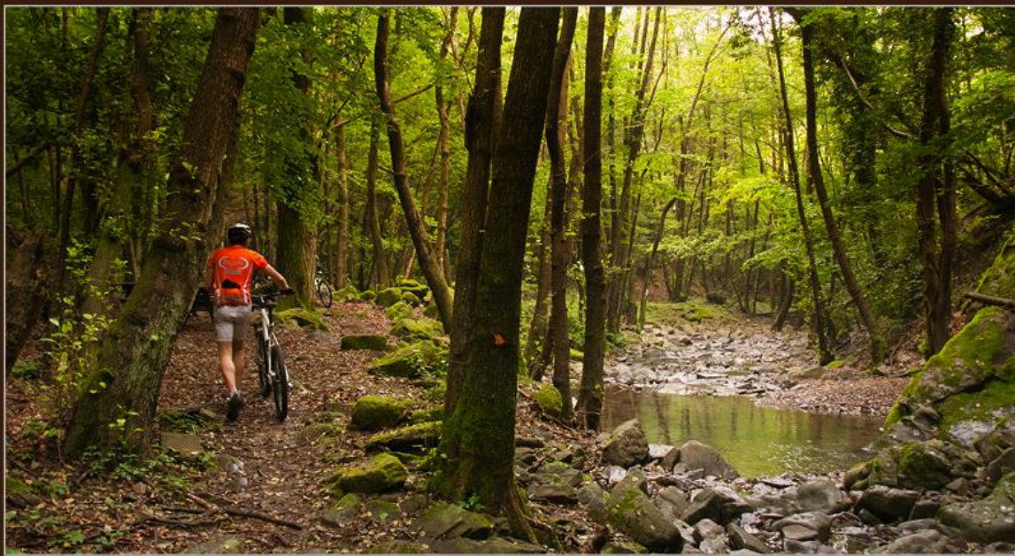
MTB nella Riserva naturale dell'Acquerino

19 GIUGNO 2011 giornata in MTB nella Riserva naturale dell' Acquerino Cantagallo (PO)